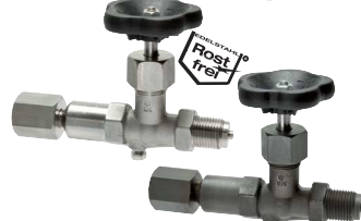
Drehbare Muffe - Zapfen mit Schaft für Messgerätehalter