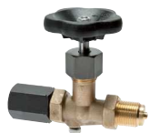
Spannmuffe - Zapfen