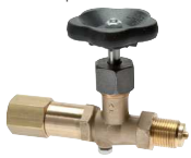
Drehbare Muffe - Zapfen mit Schaft für Messgerätehalter