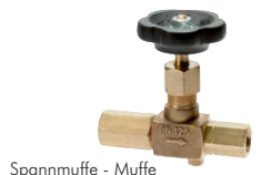
Spannmuffe - Muffe