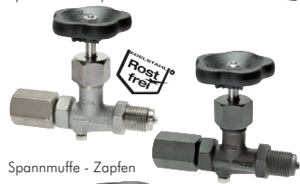
Spannmuffe - Zapfen