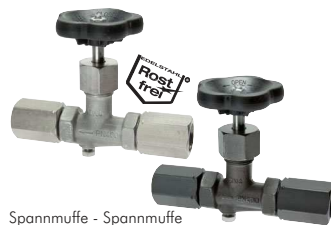
Spannmuffe - Spannmuffe