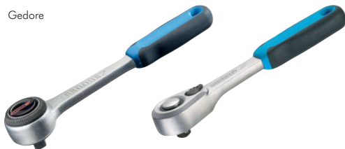
Typ ... K1 G