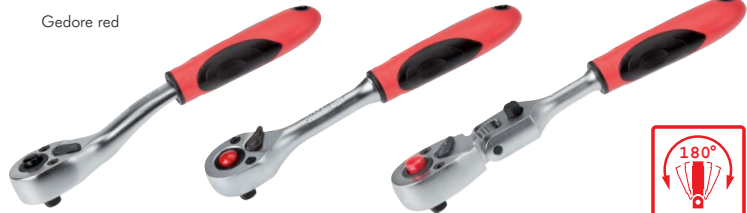
Typ ... K1 C